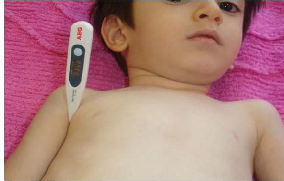
تصویر 3: نحوه قراردادن دماسنج در زیر بغل

" این پمفلت تنها به عنوان راهنما بوده و به هیچ وجه جایگزین توصیه‌های پزشک معالج کودک شما نمی باشد." اگر شما توصیه‌ها یا اطلاعات بیشتری نیاز دارید لطفاً با شماره تلفن 35262250 - داخلی 260 تماس بگیرید.