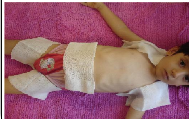
تصویر 1: محللهایی که پارچه خیس ولرم گذاشته می‌شود.

وقتی کودک تب کرد دست و پاتونو گم نکنید و به فکر مراقبت از او باشید. اولین کار اینکه بلافاصله لباس کودک را کم کنید. این کار باعث می‌شود پوست بدن خنک شود و تب کودک پایین بیاید. اگر پایین نیامد. پارچه تمیزی را با آب ولرم خیس کنید. روی شکم و روی کشاله ران و زیر بغلهای کودک بکشید بعد پارچه را برداشته و دوباره با آب ولرم خیس کنید. این کار را تا زمانی انجام دهید که تب کودک پایین بیاید.